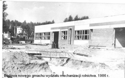
Būduva naujo gmnachu wydziału mechanizacji rolnictwa. 1986 r.