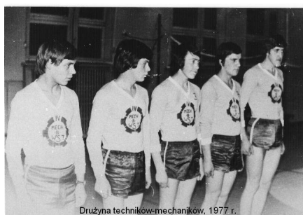
Drużyna techników-mechaników, 1977 r.